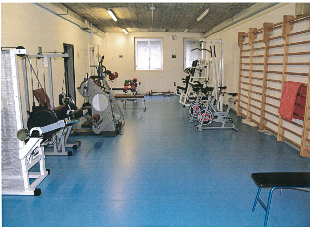
VEDUTA INTERNA DELLA PALESTRA PER FITNESS AL PRIMO PIANO INTERRATO

Ai lati del locale palestra, sono presenti delle intercapedini dove sono posizionate le scale di sicurezza che conducono all'esterno.