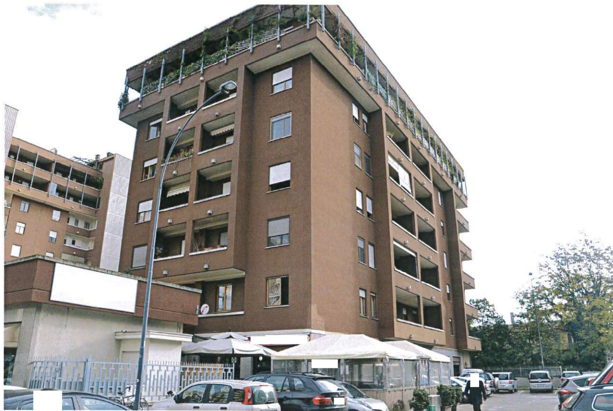
VEDUTA ESTERNA DEL CONDOMINIO "CHEOPE" (DA VIA G. TONONI)