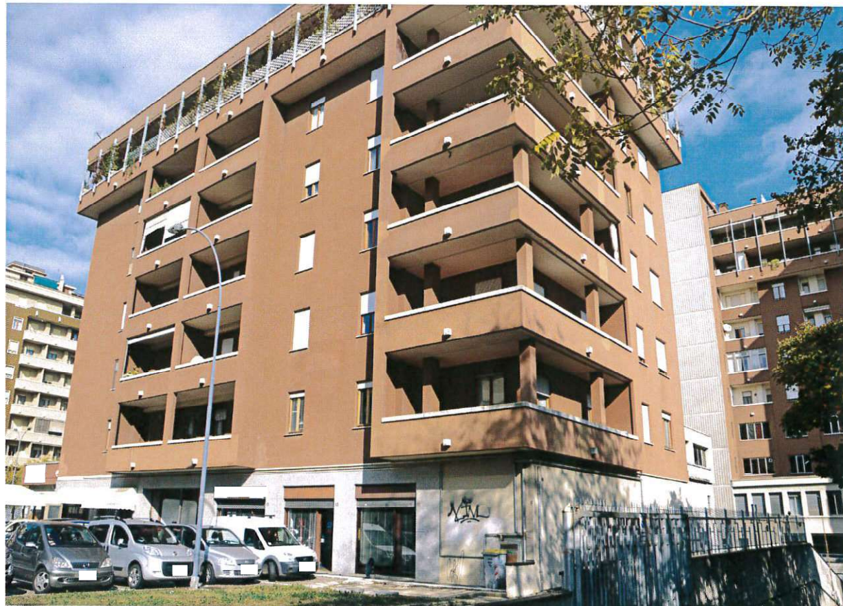
VEDUTA ESTERNA DEL CONDOMINIO "CHEOPE" (DA VIA A. NICOLODI)